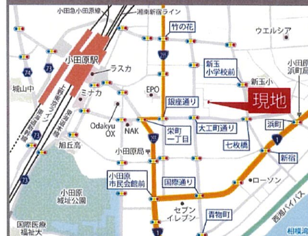
Access Guide Map 「小田原市栄町4丁目2-12」とご入力ください。